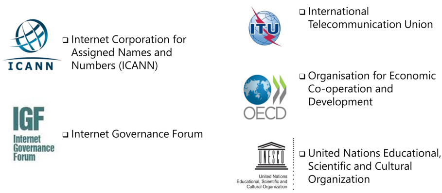
Figura 2 – Participação do CGI.br em fóruns internacionais sobre Governança da Internet

O CGI.br tem contribuído de forma ativa e permanente nos fóruns internacionais que tratam das complexas e interdependentes dimensões da governança da Internet. Além da organização e financiamento do evento NETmundial, o CGI.br e NIC.br foram também responsáveis pela organização e realização de duas edições do IGF 21 em 2007 e 2015, no Brasil, único país que sediou o fórum global por duas vezes. A Figura 2 mostra alguns dos fóruns nos quais o CGI.br assume papel preponderante no debate sobre governança de Internet.